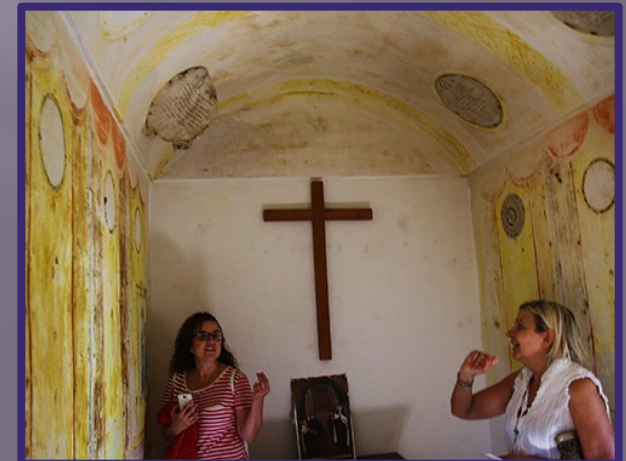
Sacristía adjunta, a la derecha de la capilla con restos de textos sagrados originales.