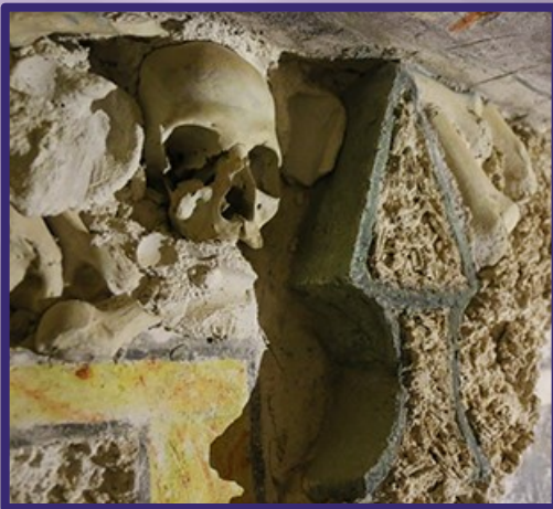
Toda la capilla inferior contiene calaveras y otros huesos de extremidades humanas.