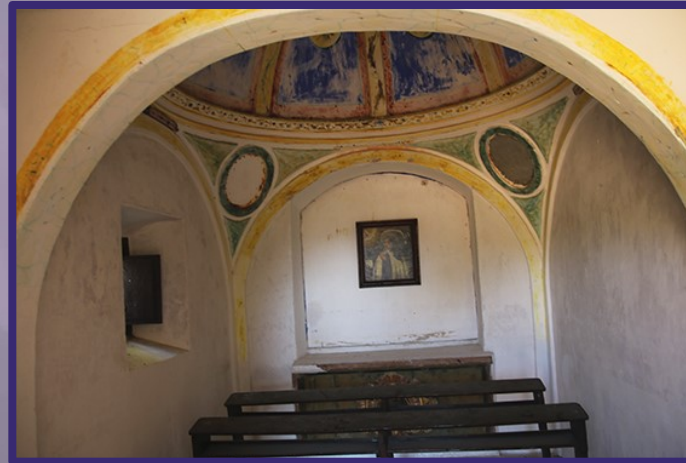
Capilla superior con cúpula interior decorada. Las pechinas contenían cuadros hoy desaparecidos con los expolios.