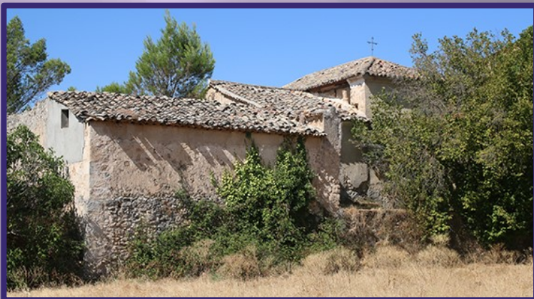
Vista de la cara norte del conjunto de "San Pedro". A la derecha la capilla y la izquierda las humildes dependencias y corral de los primeros monjes.