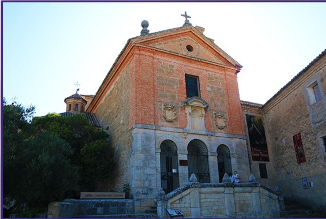
Fachada del convento del Carmen.

El conocido Convento del Carmen de Pastrana es en realidad una denominación popular. La exacta es de San Pedro con fecha de 1569. La edificación actual corresponde a la ampliación en 1601 del primigenio para dar cabida a la multitud de monjes que dieron mayor vida al original hasta su apogeo hacia 1750. Hasta 200 frailes se alojaron en esta casa que, desde 1601. Albergaba uno de los más cualificados centros de la Orden del Carmelo Descalzo . Su función principal era la de formación de nuevos freires novicios para después desperdigarse y ampliar la función de la Orden Descalza con mucha austeridad por todo el orbe posible. Hasta la Desamortización de Mendizábal en 1836 se mantuvo en pie la actividad de este convento, con el abandono de los Descalzos. Aquí se realizaron varios capítulos generales de la orden entre uno de los cuales se decidió el traslado de los restos de la Santa desde su enterramiento original hasta Ávila . Y el expolio de sus reliquias entre tanto.