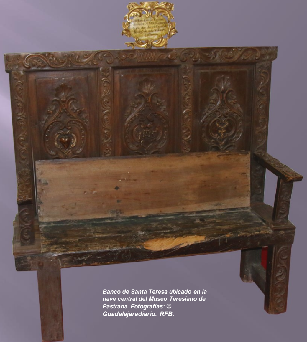
Banco de Santa Teresa ubicado en la nave central del Museo Teresiano de Pastrana.

En realidad el banco original es el austero, pero robusto, madero de la base junto con algunas de sus patas originales. El respaldo, la cubierta de preservación y los reposabrazos cuentan que son añadidos de épocas posteriores. Es de hacer notar que falta algún trozo de madera como se puede apreciar y que fue expoliado como reliquia, como era en su tiempo muy habitual con cualquier objeto de la Santa.