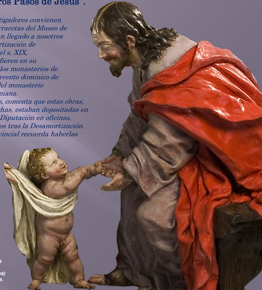
Detalle: "Primeros Pasos de Jesús" 1692-1704. Luisa Roldán (La Roldana)