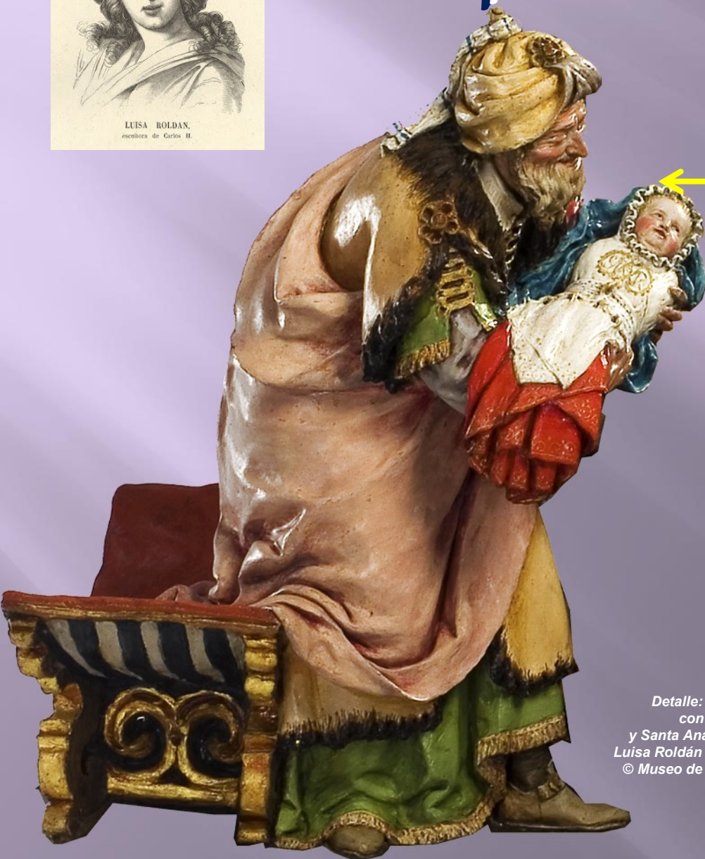
Detalle: "Virgen Niña con San Joaquín y Santa Ana" 1692-1704. Luisa Roldán (La Roldana)