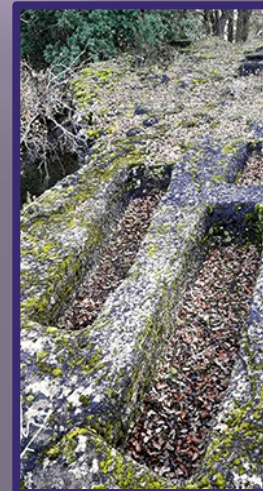
Tumbas visigodas excavadas en roca de Gualda .