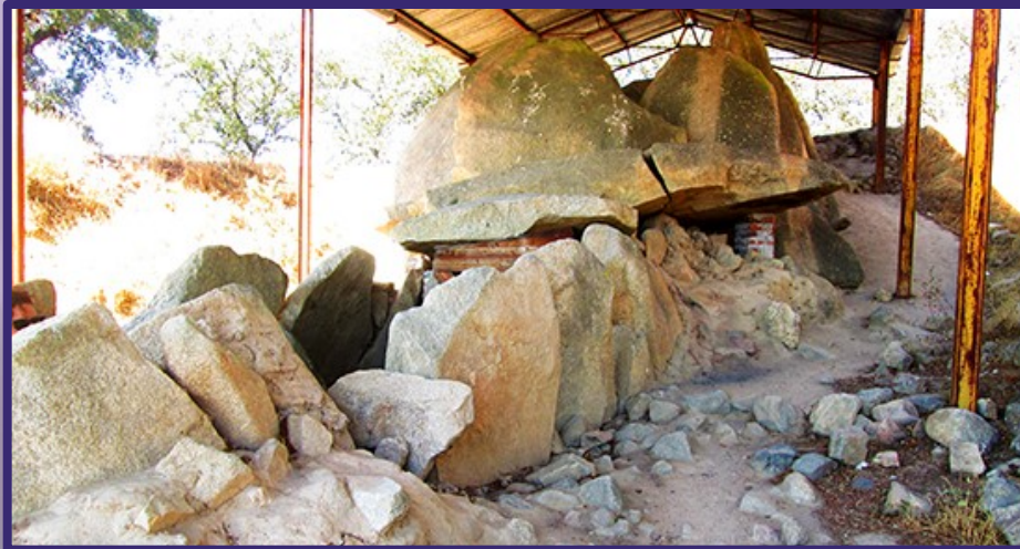
Anta Grande do Zambujeiro, en Évora, Alemtejo portugués. Uno de los mejores dólmenes conservados de cámara poligonal y largo corredor la Península Ibérica.

El dolmen del Portillo está situado en una zona fértil, nudo de comunicaciones entre las mesetas, muy cercano a un yacimiento de sal.