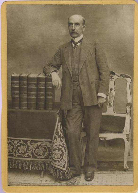
Retrato del marqués de Cerralbo, D. Enrique de Aguilera y Gamboa (1845-1922) junto a los cinco volúmenes de su obra "Páginas de la Historia Patria por mis excavaciones arqueológicas".