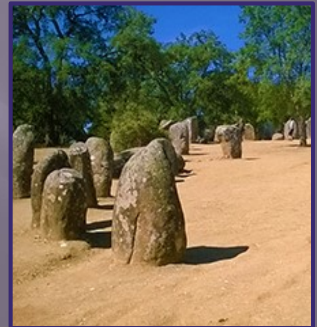
Izquierda Menhir. Superior e inferior, cromlech del Alemejeo portugués.