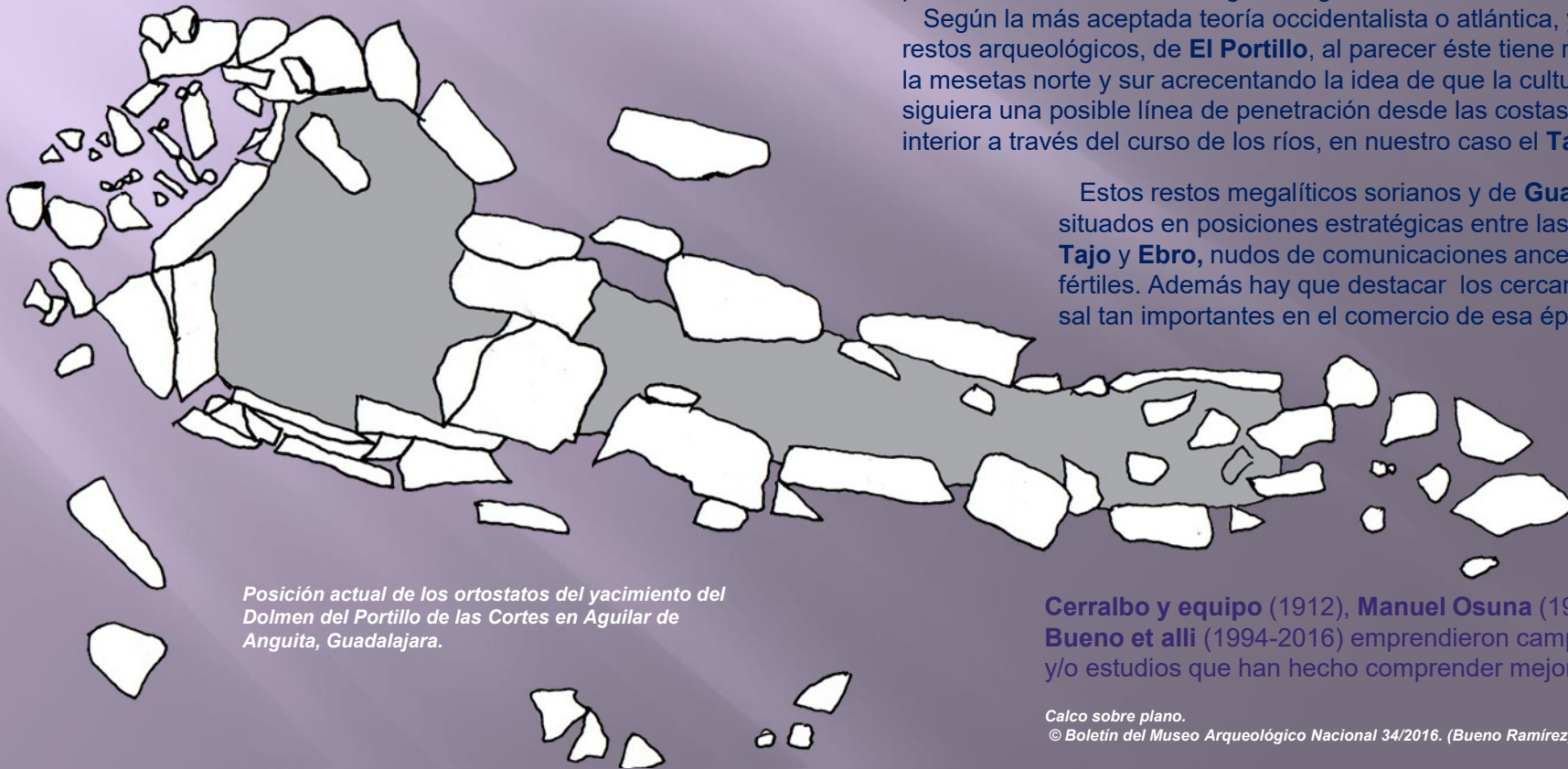
Posición actual de los ortostatos del yacimiento del Dolmen del Portillo de las Cortes en Aguilar de Anguita, Guadalajara.

Estos restos megalíticos sorianos y de Guadalajara están situados en posiciones estratégicas entre las vertientes del Tajo y Ebro , nudos de comunicaciones ancestrales y tierras fértiles. Además hay que destacar los cercanos yacimientos de sal tan importantes en el comercio de esa época.